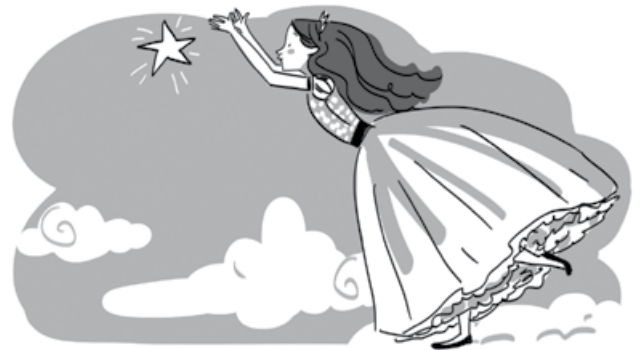
RUBÉN DARÍO: “A Margarita Debayle”, en Poesía , Alianza