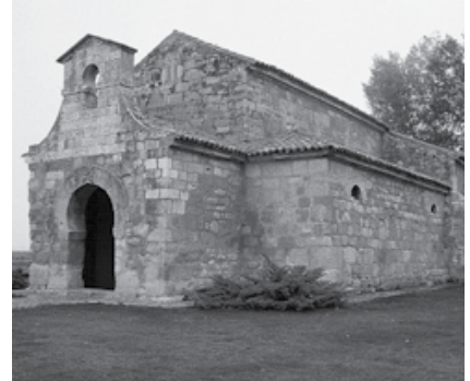
San Juan de Baños, siglo VII

ARTE VISIGODO Las iglesias eran de pequeño tamaño y estaban decoradas con motivos geométricos o vegetales.