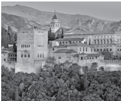
Alhambra de Granada, siglo XIV

ARTE ANDALUSÍ Utilizó el arco de herradura y las cúpulas. Sus construcciones se hacían con materiales humildes, pero eran decoradas de manera rica y abundante.