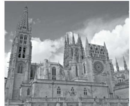
Catedral de Burgos, siglo XIII

ARTE ROMÁNICO Las iglesias presentaban muros gruesos y ventanas pequeñas con formas redondeadas. Las paredes se decoraban con pinturas y esculturas de colores.