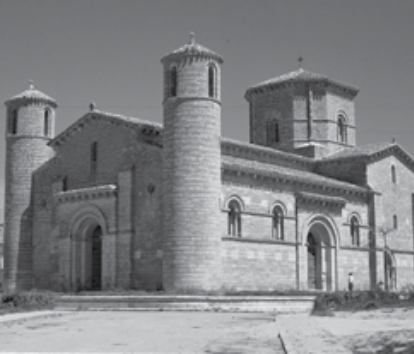
San Martín de Frómista, siglo XI